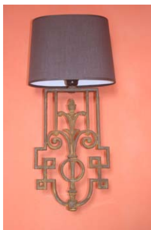
Lampe dans la chambre Athos