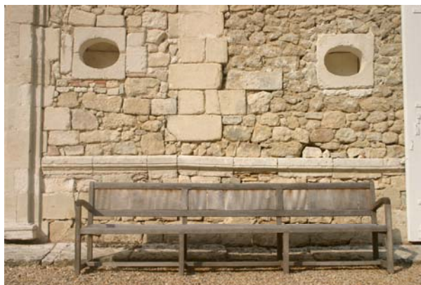
Chartreuse du 17 ième siècle avec ces fenêtres « œil de bœuf » d'origine

Vous êtes aimablement conviés à séjourner dans l'une de nos chambres d'hôtes grand confort décorées avec soin et dotées d'une salle de bain et de toilettes individuelles. Le grand salon et la salle à manger sont à votre disposition.