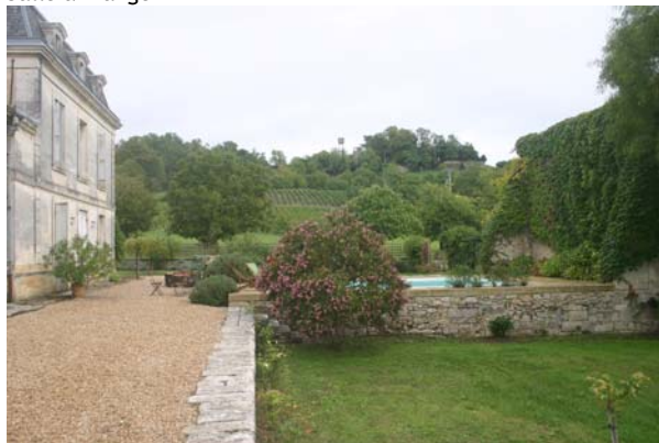
Jardins avec piscine

'If God forbade drinking, would He have made wine so good?' Cardinal Richelieu