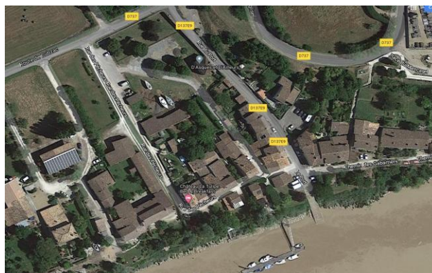
* HALTE NAUTIQUE

Aucune installation définitive n'est comprise dans cette convention.